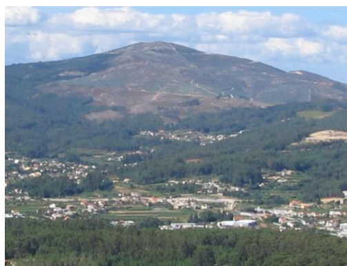
Monte Xiabre (Vilagarcía de Arousa) https://www.vilagarcia.com/monte-xiabre/