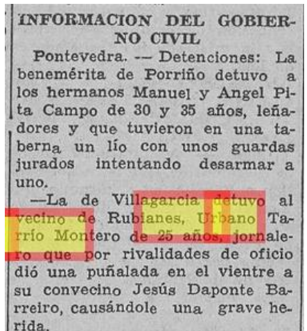
El Pueblo Gallego, 22-1-1936, p. 32.