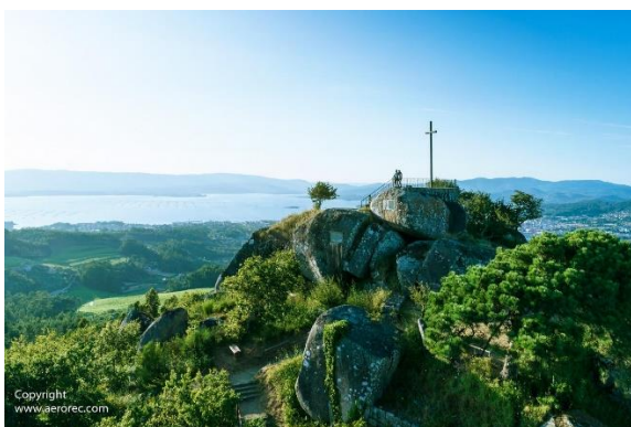
Monte Lobeira (Vilanova de Arousa) https://www.osalnes.com